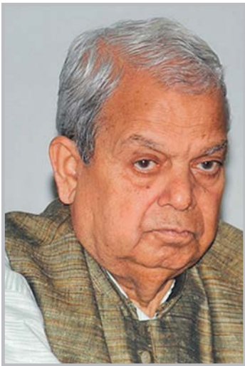
मुकुन्द लामिछाने/मध्यान्ह काठमाडौं, २६ फागुन ।

राप्रपासहित साना दलहरू एमाले-माओवादीको समीकरणमा लाग्ने कि प्रतिप्रक्षमा बसेर कांग्रेसलाई साथ दिने भन्नेमा छटपटी छ । उनीहरू अस्थिर राजनीतिले आफूहरूलाई समेत अस्थिर बनाउन खोजेको टिप्पणी गर्छन् ।