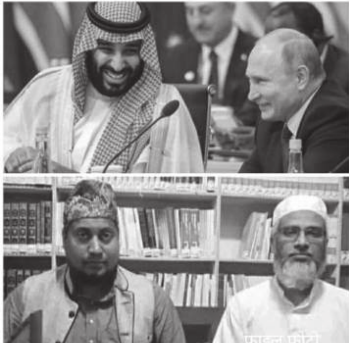
विषयमा सहमति भएको छ । एएफपी शक्रवार राष्ट्रपति भ्लादिमिर पुटिन समाचार एजेन्सीको रिपोर्टमा रूसले र साउदी युवराज मोहम्मद बिन

साउदी अरबको मध्यस्थतामा रूस र युकेनबीच युद्धबन्दी आदानप्रदानको