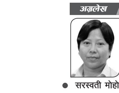
● सरस्वती मोहोरा

महिलाहरूको कुरा गर्दा, महिला छुट्टै लिङ्ग भएको हुनाले स्वाभाविकरूपमा महिलासित यौनको कुरा पनि जोडिएर नै आउँदछ। तर त्यसो भन्दा महिला समस्यालाई हेर्ने यौन केन्द्रित वा यौनवादी दृष्टिकोण भने ठिक होइन। त्यो पुँजीवादी महिलावादीहरूको लिङ्गवादी, यौनवादी दृष्टिकोण र सोच हो।