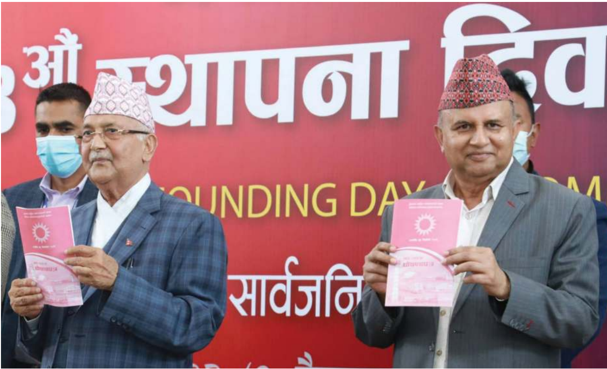
दिवाकर अधिकारी / मध्यान्ह काठमाडौं, ९ वैशाख ।

स्थानीय चुनाव आउन २३ दिन बाँकी रहँदा शुरुबार प्रमुख विपक्षी दल नेकपा एमालेले घोषणापत्र सार्वजनिक गरेको छ । ४८ पृष्ठ लामो घोषणापत्रमाफत 'समृद्ध नेपाल, सुखी नेपाली'को आकांक्षा पूरा गर्न मतदातासँग मत मागेको छ । एमालेले गठबन्धन सरकार कायमै रहने परिस्थितिमा मुलुक थप संकटतर्फ धकेलेको निष्कर्ष पनि निकालेको छ ।