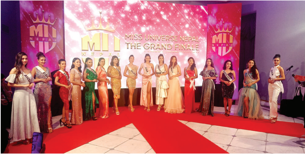
द्विप्रेम श्रेष्ठ/मध्याह्न काठमाडौं, ५ कात्तिक मिस युनिभर्स को ग्राण्ड