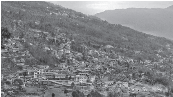
रमन वन/मध्यान्ह सोलुखुम्बु, ५ कात्तिक

जिल्लाको धेरैजसो सरकारी कार्यालयका कर्मचारीहरू दशैं विदा पछि काममा नफर्किएको पाइएको छ। विहीवार दशैं विदा सकिएको ४ दिन बितिसक्यो पनि धेरैजसो सरकारी कार्यालयका प्रमुख तथा कर्मचारीहरू कार्यालय नफर्किएको पाइएको हो। सोलुखुम्बुसहित प्रदेश १ का सरकारी कार्यालयहरू कात्तिक एक गते सोमवारबाट खुलेपनि कर्मचारीहरू भने बिभिन्न बाहना बनाउँदै काममा फर्कन आनाकारी