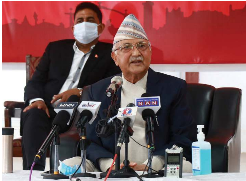
नेकपाका संस्थापक पुष्पलाल श्रेष्ठको ८३औं स्मृति दिवसमा बिहीबार आयोजित कार्यक्रममा एमालेका अध्यक्ष केपी ओली ।

नेकपा एमालेका अध्यक्ष केपी शर्मा ओलीले बरिष्ठ नेता माधवकुमार नेपाल समूहलाई आम माफी दिएकाे घोषणा गरेका छन् । स्पष्टिकरण सोध्ने, कारबाही गर्ने र फेरि फिर्ता लिने ओलीको लगभग नियति नै बनेको छ ।