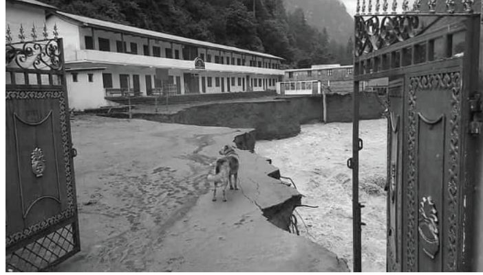
मनाङ सदरमुकाम चामेलस्थित मर्स्याङ्दी नदीको बाढीले कटान गरेको लोकप्रिय मावि।

लताकपडालगायत सामग्री ढुवानी भने महँगो पर्ने भएकाले तत्काल