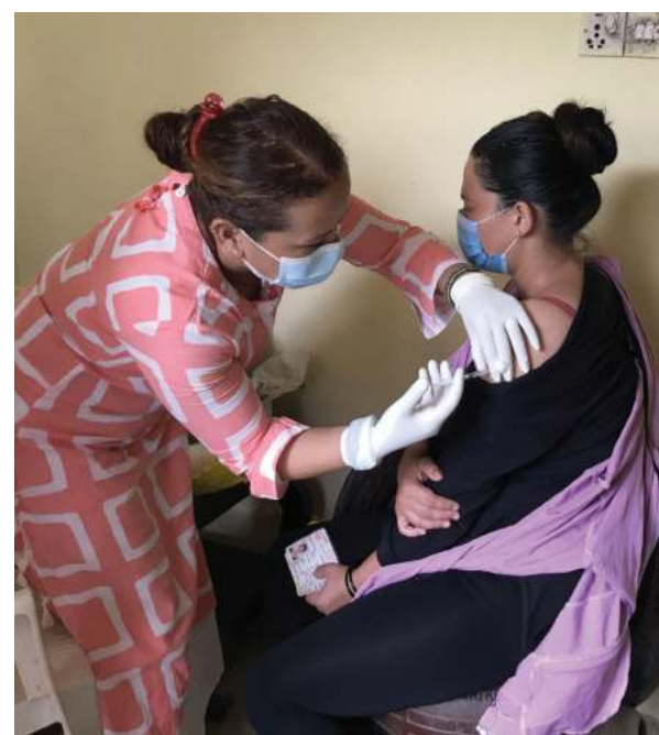
बागलुङ नगरपालिका-८ मा कोभिड-१९ विरुद्धको रोगी अभिधान सञ्चालन गरिँदै ।

नेपालमा गत चैत दोस्रो सातादेखि दोस्रो लहरको संक्रमण छ । नेपालमा अहिलेसम्म सात लाख २४ हजार ४५५ व्यक्तिमा संक्रमण पुष्टि भएको छ । छ लाख ३६