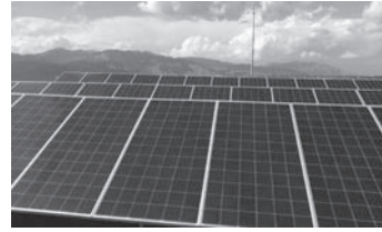
बनेपछि स्थानीयवासी हर्षित भएका छन्। गाउँपालिकाको ३० लाखसहित तीन करोड एक लाख ८८ हजार रूपैयाँमा सौर्य ऊर्जा जडान गरिएको