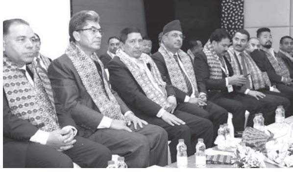
दोहा, कतार, २२ फागुन