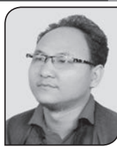
● निष्पु थिङ