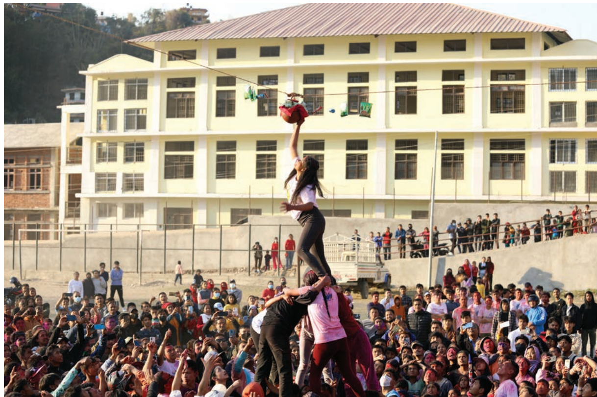
गुल्मीको सदरमुकाम तम्घासमा होलीको अवसरमा आयोजित कार्यक्रममा सहभागीहरू । सोमबार पहाडी क्षेत्रमा मनाइएको होली आज तराई मधेशमा मनाइँदैछ ।