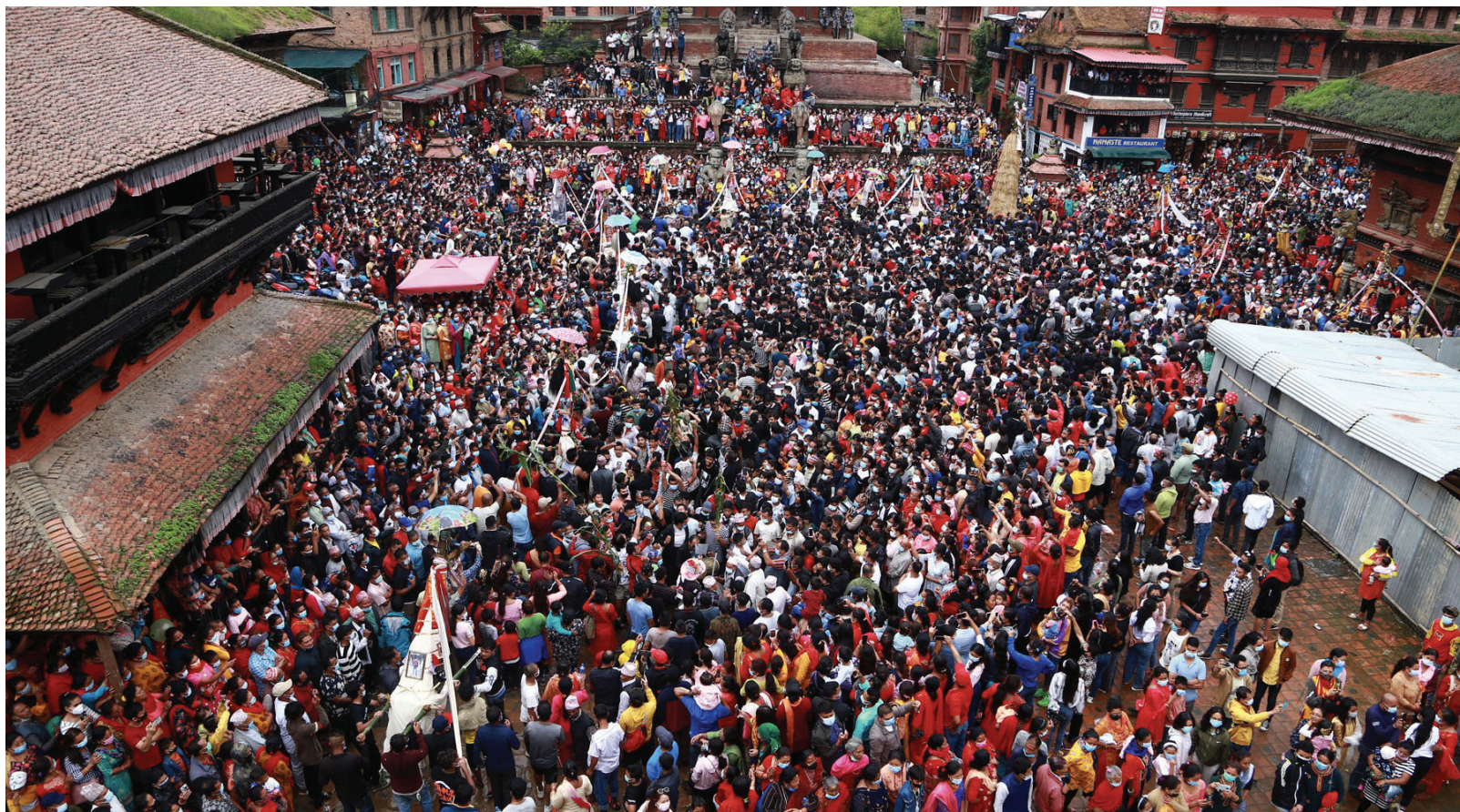
भक्तपुरमा जाइजात्रा मनाउँदै । नेवार समुदायले आफ्ना दीवङ्गत पितृका स्मरणमा जलैपूजाको ओलिपल्ट जाइजात्रा निकाल्ने चलन छ ।