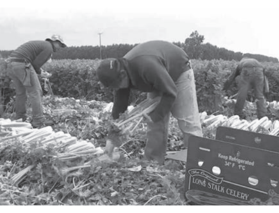
के प्रवासी श्रमिक विदेशी भएकै भएर यसो भएको हो ? कोरियामा प्रवासी श्रमिकले धार्मिक, जातिय, वर्णीत विभेदको सामना गर्नु परेको छ । कोरियाको सार्वजनिक स्थान या सार्वजनिक यातायातका साधन प्रयोग गर्दा प्रवासी श्रमिकलाई फरक दृष्टिकोणबाट हेर्ने गरिन्छ । प्रवासी श्रमिक पनि कोरियन जस्तै मानिस अनि श्रमिक हुन् । अभद्र व्यवहार गर्दा किन यसको विरुद्धमा कुरा उठाउन सक्दैन त प्रवासी श्रमिक ? प्रवासी श्रमिक कोरियन नागरिक नभएकै कारणले किन भेदभाव भोग्नु परेको होला ? कोरियन सरकारले प्रवासी मजदुरको आवश्यकता परेर ल्याएको भए पनि किन दासको जस्तो व्यवहार गर्छ प्रवासी श्रमिकमाथि ?

प्रवासी श्रमिकमाथि कोरियामा जवर्जस्ती पसेको घुस पैठियाको जस्तो व्यवहार गरिन्छ । अपराधीक जातिविधि गर्ने अपराधी सोचिन्छ र खाँने नपाएर अष्टको कंगाल जस्तो नजरले हेरिन्छ कोरियामा । रोजगारदाता प्रवासी श्रमिकले गधाले जस्तो काम गर्न सकेन, सधैँ उसको बफादार दास जस्तो भएर, नजर भुकाएर हेरेन र कम्मर भाँच्चिने गरि ढोगेन भने राम्रो मान्दैनन् । कार्यस्थलमा धम्की, कुटपिट, गाली-गलौच र अनेकन अभद्र व्यवहारको सामना गर्नुपर्ने बाध्यता छ । प्रवासी श्रमिक यौन हिंसाको शिकार हुन, कुटपिट र गाली सहन कोरिया आएको होइन । प्रवासी श्रमिकले कोरियन नागरिकलाई ठेगाना सोध्ने भएमा जेल जानुपर्छ तर, कार्यस्थलमा प्रवासी श्रमिकमाथि कुटपिट, गाली गलौच, दुर्व्यवहार भैरहँदा प्रमाणित गराउन गाह्रो हुन्छ ।