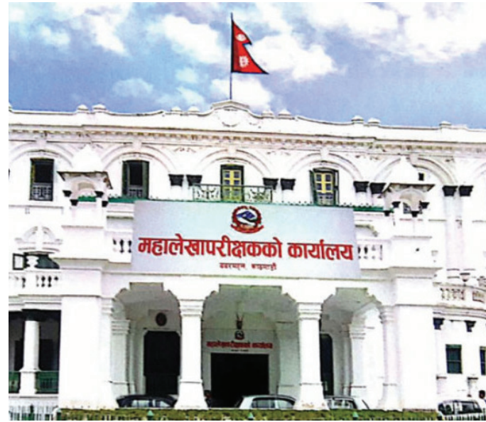
सागर तिमल्सिना/मध्याह्न काठमाडौं, ७ भदौ ।

सरकारको कुल सार्वजनिक ऋण १४ खर्ब रुपैयाँ पुगेको छ । महालेखा परीक्षकको कार्यालयले शुक्रबार सार्वजनिक गरेको प्रतिवेदनअनुसार सरकारको कुल ऋण १४ खर्ब १९ अर्ब ८७ करोड रुपैयाँ पुगेको हो । जुन आर्थिक वर्ष २०७७ को असार मसान्तसम्मको मात्रै तथ्यांक हो । महालेखाका अनुसार कुल ऋणमध्येबाट ८ खर्ब ६ अर्ब १४ करोड रुपैयाँ वाय्त्य र ६ खर्ब १३ अर्ब ७३ करोड रुपैयाँ आन्तरिक ऋण रहेको छ । सरकारको वाय्त्य ऋण ५६.५३ प्रतिशतले बढेको छ भने ४३.२३ प्रतिशत आन्तरिक ऋण बढेको छ ।