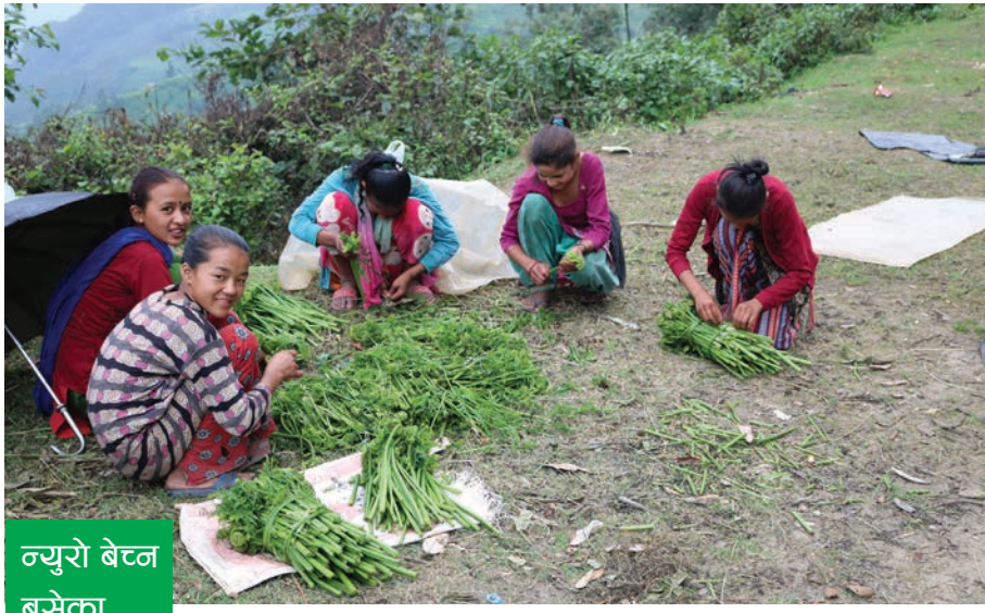
न्युरो बेन्ज बसेका बालिका

डोटीको पूर्वीचौकी गाउँपालिकाको चौखुट्टे बजारनजिक खोलाबाट टिपेर ल्याएको न्युरो बिक्रीका लागि बसेका बालिका ।