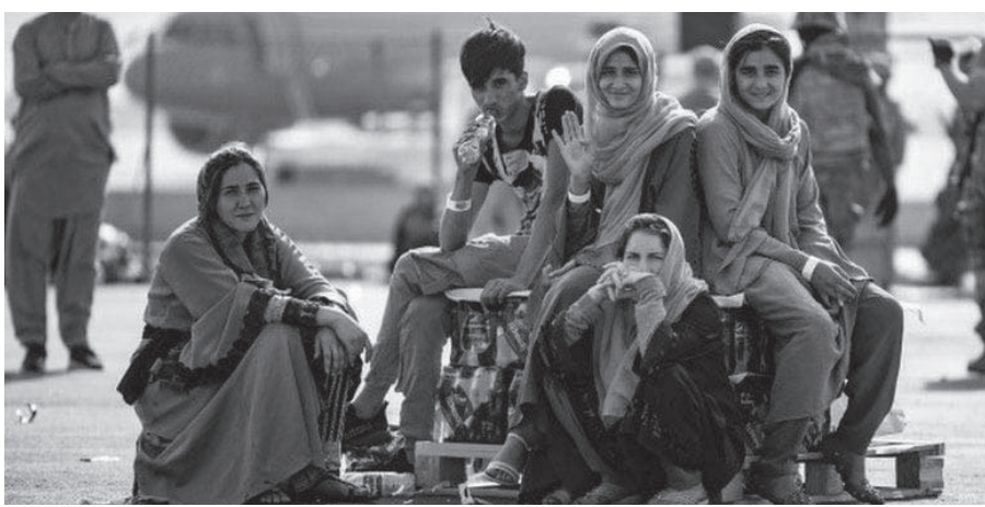
भागवौड तथा गोली लागेर कम्तीमा २० जनाको ज्यान

बाइडेनले आइतबार दिएको जानकारी अनुसार एक हप्ताकोविचमा अमेरिकाले अफगानिस्तानबाट २८ हजार मानिसको उद्धार गरेको छ। इवाइट हाउसमा भएको पत्रकार सम्मेलनमा राष्ट्रपति बाइडेनले भने, 'पीडा तथा तपाईंहरूले देखिनु रहुनु भएका हृदयविदारक दृश्य विना त्यहाँबाट थपै मानिसहरूको उद्धारको सम्भावना छैन। हामीले अझै लामो यात्रा गर्नु छ र त्यस क्रममा गल्लीहरू हुन सक्छन्।' काबुल विमानस्थल बाहिर हजारौं मानिस भिडभाड गरिरहेका छन्। अहिलेसम्म