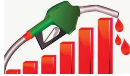
काठमाडौं/मस - नेपाल आयल निगमले पेट्रोलियम पदार्थको मूल्य बृद्धि गरेको छ । सोमबार राति १२

बजेदेखि लागू हुनेगरी निगमले नयाँ मूल्य सार्वजनिक गरेको हो । पेट्रोलमा २ रुपैयाँ, डिजेल/मिट्टिरेलमा ९ रुपैयाँ र हवाई इन्धनमा ५ रुपैयाँ बृद्धि गरिएको निगमले जनाएको छ । एलपी ग्यासमा भने साविककै मूल्य रहने निगमले जनाएको छ ।