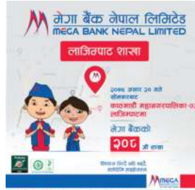
गरेको विज्ञप्तिमा उल्लेख छ ।

काठमाडौं/मस - मेगा बैंक नेपालले काठमाडौंको लाजिम्पाटमा सोमबार नयाँ शाखा विस्तार गरेको छ । काठमाडौं महानगरपालिका वडा नम्बर २, लाजिम्पाटमा मेगा बैंकले नयाँ शाखा विस्तार गरेको हो ।