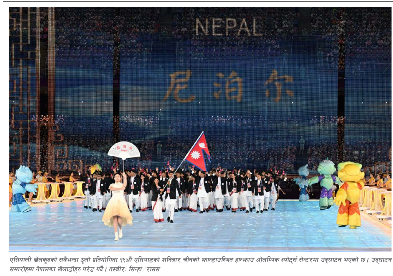
एसियाली खेलकुदको सबैभन्दा ठूलो प्रतियोगिता १९औँ एसियाडको शनिबार चीनको भान्डाउस्थित हान्फाउ ओलम्पिक स्पोर्ट्स सेन्टरमा उद्घाटन भएको छ। उद्घाटन समारोहमा नेपालका खेलाडीहरू परेड गर्दै।