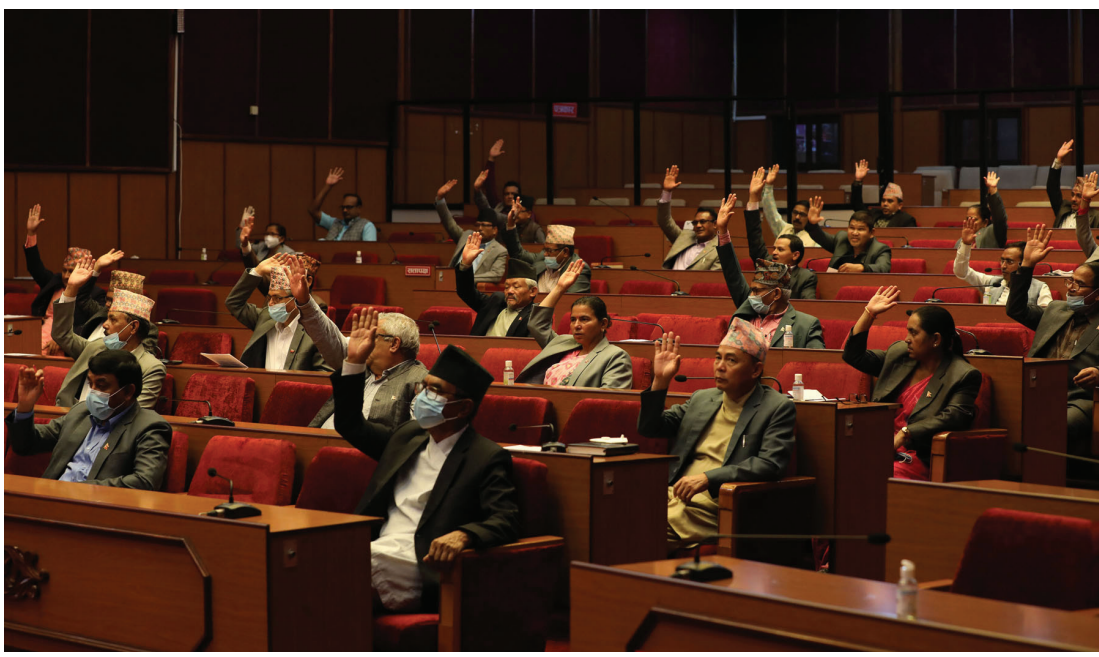
राष्ट्रियसभाको बिहीबारको बैठकमा नेपालको संविधान (दोस्रो संशोधन) विधेयक २०७७ पारित गर्दै सांसदहरू।