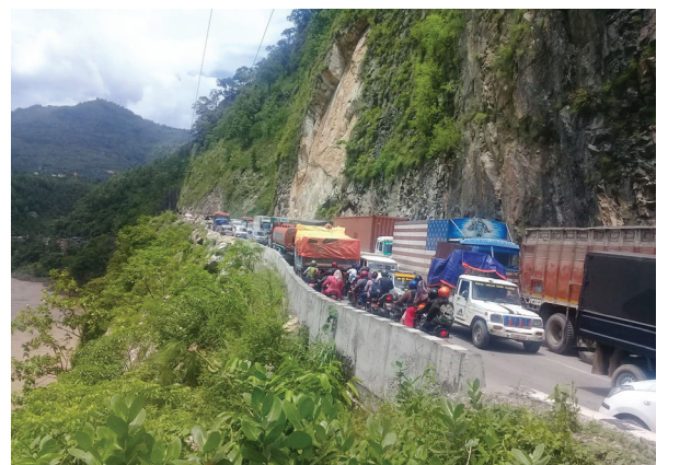
पहिलोकारण गन्तव्यमा जान नपाएपछि नारायणगढ - मुग्लिन सडकमा देखिएको सवारीको लाइन। तस्वीर : नारायण डुङ्गाना

कोभिड महामारीको संक्रमण दिनहु तीव्र गतिमा बढेको छ। स्वास्थ्य तथा जनसंख्या मन्त्रालयले महामारीबाट संक्रमित हुनेको संख्या दिनहु तीव्र गतिमा बढेको जानकारी दिएको छ। गएको २४ घण्टामा मात्रै ६७१ जनामा संक्रमण पुष्टि भएको मन्त्रालयले जनाएको छ। एकै दिन पुष्टि भएको यो अहिलेसम्मकै उच्च संख्या हो। बिहीबार सम्मको तथ्यअनुसार, नेपालमा संक्रमित संख्या सात हजार ८४८ पुगेको छ। यी सबै पीसीआर प्रणालीबाट पुष्टि भएको संख्या हो। देशभरका २४ प्रयोगशालाबाट अहिलेसम्म एक लाख ५५ हजार ५८१ जनाको पीसीआर परीक्षण भएको छ। आरडीटी प्रणालीबाट पनि परीक्षण रोकिएको छैन। बिहीबारसम्म दुई लाख ४३ हजार ७५ जनाको