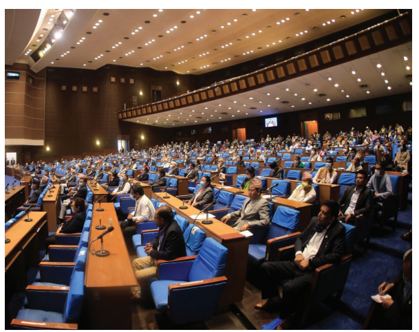
भएको 'नेपालको संविधान (दोस्रो राष्ट्रियसभाबाट पारित भएको संशोधन) विधेयक, २०७७' सन्देशको जानकारी गराए।

काठमाडौं / मस - प्रतिनिधिसभाको विहीवारको बैठकले 'धितोपत्रसम्बन्धी (पहिलो संशोधन) विधेयक २०७६' लाई दफावार छलफलका लागि संसदीय समितिमा पठाएको छ। अर्थमन्त्री डा युवराज खतिवडाले उक्त विधेयक दफावार छलफलका लागि सम्बन्धित समितिमा पठाइयोस् भनी प्रस्ताव प्रस्तुत गरेका थिए। बैठकमा 'सार्वजनिक खरिद (दोस्रो संशोधन) विधेयक, २०७७' पेश भएको छ। प्रधानमन्त्री केपी शर्मा ओलीको तर्फबाट अर्थ एवं सञ्चार तथा सूचना प्रविधिमन्त्री डा युवराज खतिवडाले उक्त विधेयक पेश गरेका हुन्।