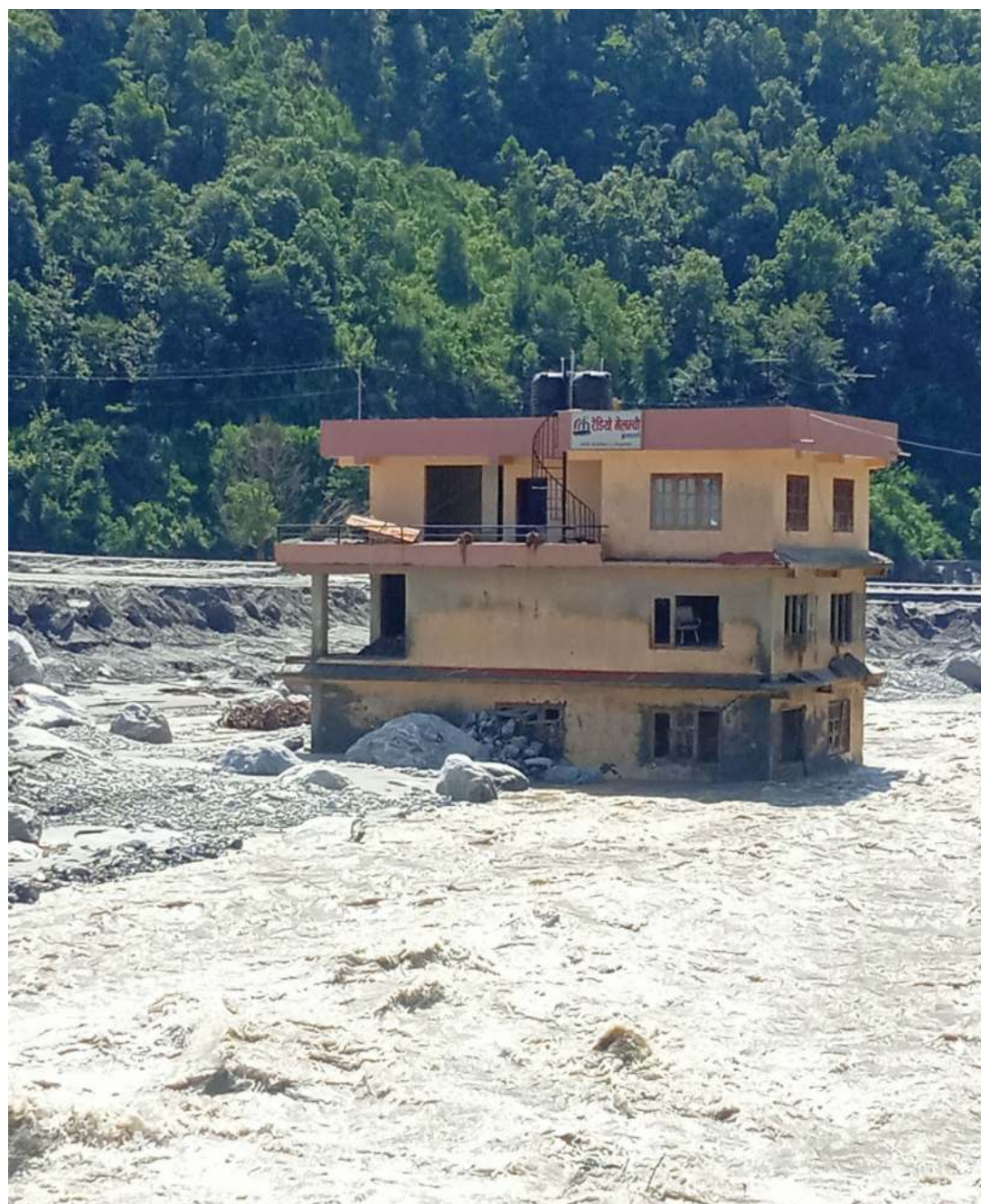
बाढीबाट विनाश: कोलठवी बजारमा जाएको १ असारमा लेदोसहित आएको बाढीले यहाँका धेरै घरहरूमा गिरि पसेको छ । अर्को पलिन सडक, घर, विद्यालय लगायत सार्वजनिक अवन र स्थानमा लेदो हटिसकेको छैन ।