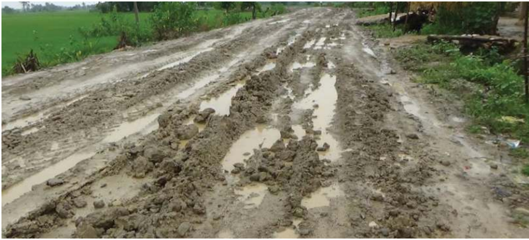
हिमेश विक/मध्यान्ह धनगढी, ३१ असार ।

कैलालीको गौरीगंगा नगरपालिकाको मसुरियादेखि कैलारी गाउँपालिकाको हसुलिया जोड्ने सडक कालोपत्रेको योजना अलपत्र परेको छ । सडक डिभिजन कार्यालय कञ्चनपुरमार्फत हसुलिया खण्डमा भएका ५ वटा कालोपत्रेका ठेक्का योजना अलपत्र परेका हुन् ।