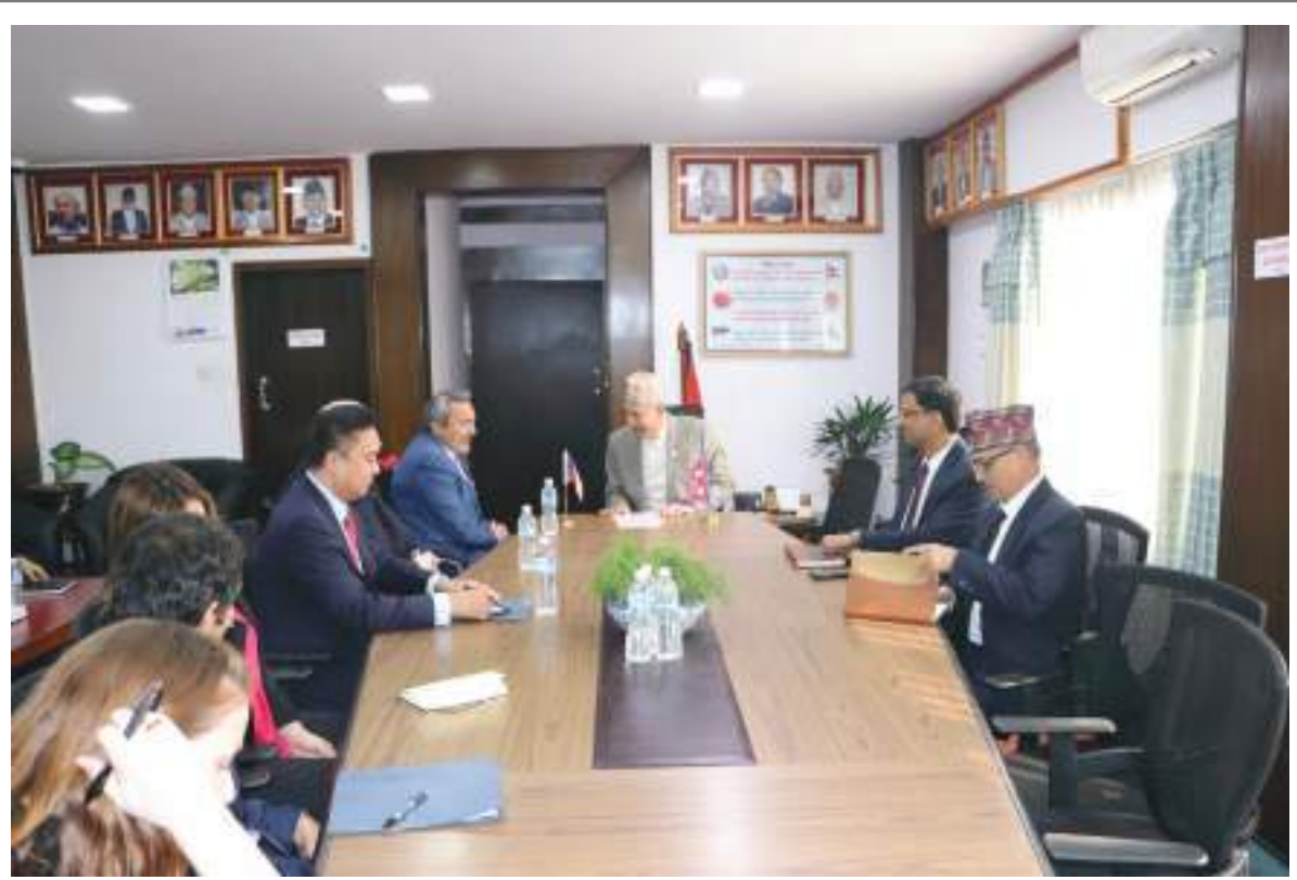
अर्थमन्त्री डा. युवराज खतिवडासँग संयुक्त राज्य अमेरिका कांग्रेसका सदस्यद्वय जर्ज होल्डिङ र अमी बेरा लगायतको टोली। बिहीबार सिंहदरबारस्थित अर्थमन्त्रालयमा भएको भेटवार्तामा अर्थमन्त्री खतिवडाले अमेरिकी सहयोग नियोग मिलेनियम च्यालेन्ज कर्पोरसन (एमसीसी) संसदबाट अनुमोदन हुने बताएका छन्।