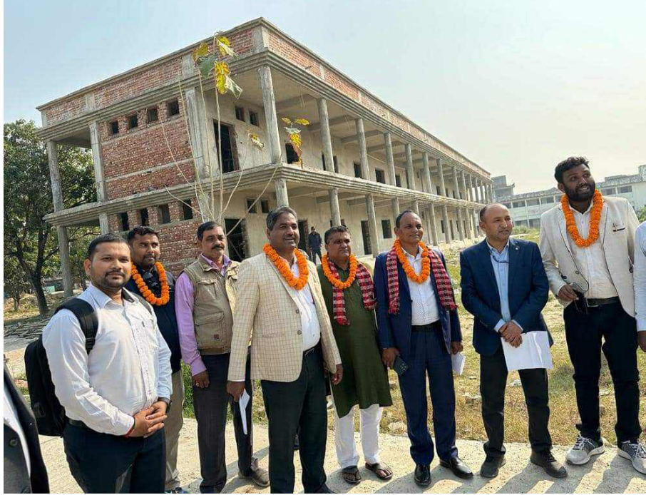
आफूले शुरू गराएको एकीकृत शहरी आयोजनाअन्तर्गत फण्डे ४० कि.मि. सडक कालोपत्रे, ८० कि.मि. नाला, विभिन्न पोखरी सौन्दर्यकरण तथा मठ मन्दिरलागतका पूर्वाधारका

अध्यक्ष साहले आफ्नो कार्यकालमा पारित गरिएको आयोजनाको निर्माणाधीन कार्यवारे स्थलगत अनुगमन गरेका हुन् । साहले निर्माण भइरहेको जनकपुर बसपार्क, दुधमती कोरिडोर, सरस्वती माध्यमिक विद्यालयको भवनलागतका आयोजनाहरूको कार्य प्रगति समग्रमा सन्तोषजनक रहेको बताए ।