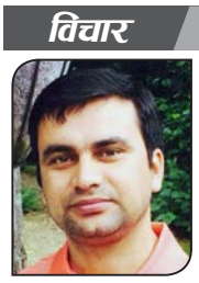
● नारायण गाउँले

एनसेलको शेर खरिद-बिक्रीको घटनापछि थुप्रै प्रश्नहरू उठेका छन् । धेरैले शेर बिक्रीमा अर्बौंको कर छलि गरिएको भन्ने मानेका छन् । स्वभाषिक पनि १४३ अर्बमा किनिएको सम्पत्ती जम्मा छ अर्बमा बेचिएको छ । तर, यसका भित्र विषयलाई बुझ्न आवश्यक छ । सबैभन्दा पहिले बुझ्नुपर्ने विषय, एनसेल नेपालमै छ । जस्ताको त्यस्तै छ । उसको विजनेश, अपरेसन, लाइसेन्स, चल-अचल सम्पत्ति पनि नेपालमै छ । उसले हरेक वर्ष एउटा विजनेशले बुझाउनुपर्ने कर पनि बुझाउँछ । यो ठूला करदातामध्येको एक हो । धेरैलाई रोजगारी पनि दिएको छ । सिम कार्ड पाउन नेताको सोसं चाहिने बेला मार्केटमा पसेर दूरसञ्चारलाई सर्वसुलभ र प्रतिस्पर्धी बनाउन ठूलो योगदान दिएको पनि धेरैलाई याद नै होला ।