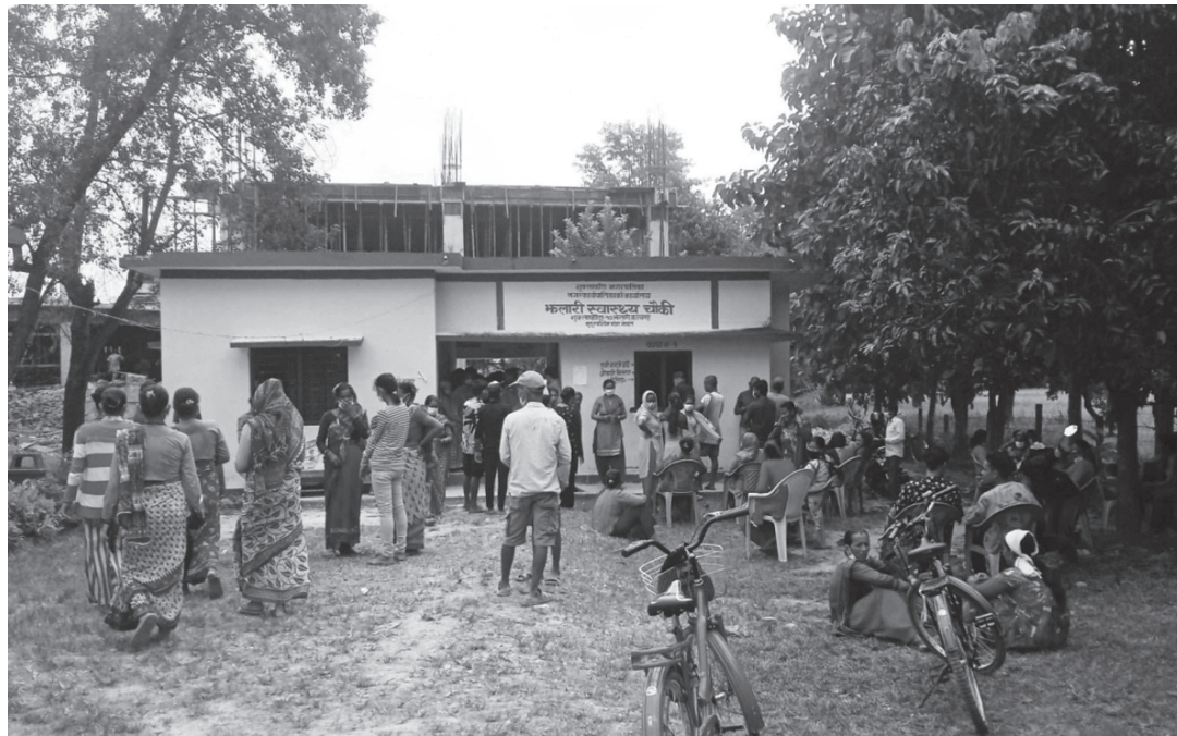
शुक्लाफाँटा नगरपालिका- १० फ्लोरीडस्थित स्वास्थ्य चौकीमा कोरोनाविरुद्धको खोप लगाउन पुगेका स्थानीय बासिन्दा ।

काठमाडौंमा खोप अभियान यथैवीच सोमवारदेखि काठमाडौं जिल्लामा कोरोना भाइरसविरुद्धको खोपको पहिलो मात्रा लगाउन शुरू गरिएको छ। जिल्ला स्वास्थ्य कार्यालय काठमाडौंले काठमाडौं महानगरपालिका, कीर्तिपुर नगरपालिका, चन्द्रागिरी नगरपालिका, नागाजुन नगरपालिका, तार्केश्वर नगरपालिका, वसिष्ठकाली नगरपालिका, बुढानिलकण्ठ नगरपालिका, टोका नगरपालिका, गोकर्णेश्वर नगरपालिका,