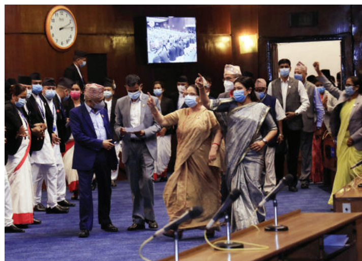
प्रतिनिधिसभा बैठक अवरोध गर्दै नेकपा एमालेका सांसदहरु ।

संसदमा बहुमत कायम राख्न राजनीतिक दल सठबन्धी अध्यादेश ल्याएर नेकपा एमाले विभाजन गर्न अध्यादेश ल्याएको प्रधानमन्त्री शेरबहादुर देउवाले आइतबार उक्त अध्यादेश खारेज गरेका छन् ।