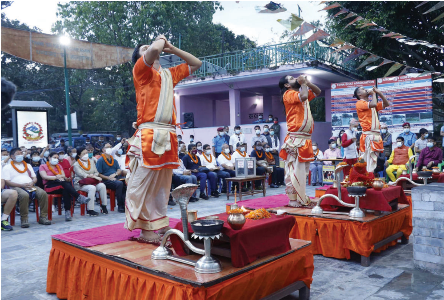
विश्व पर्यटन दिवसका अवसरमा पोखरा पुगेका नेपालस्थित विभिन्न राष्ट्रका राजदूत सहित कुटनीतिक नियोगका पदाधिकारीहरु फेवातालस्थित ताल बाराही मन्दिरको आरतीमा सहभागी ।