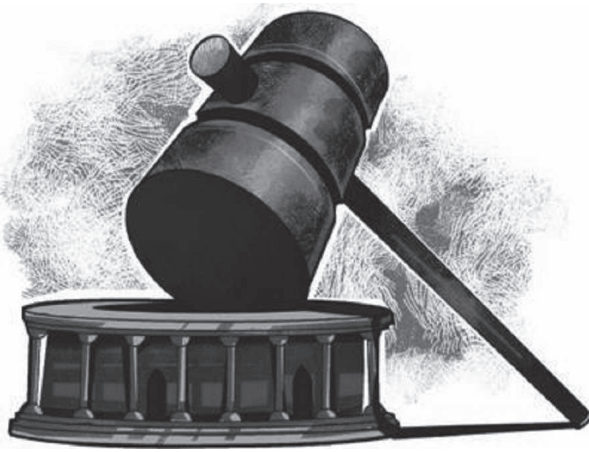
कार्यालयले गरेको निर्णयानुसार थप १३ लाख ८० हजार जगदम्बाले कारवाहीस्वरूप जरिवानावापत रु बुझाएको कार्यालयले जनाएको छ ।