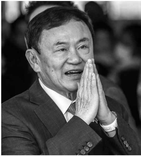
पाएका सिनावात्रा १५ वर्षका निर्वासित जीवनपछि स्वदेश फर्केको केही घण्टामा नै जेलमा परेका छन्।

काठमाडौं/एजेन्सी- थाइल्याण्डको सर्वोच्च अदालतले पूर्वप्रधानमन्त्री थाक्सिन सिनावात्रालाई आठ वर्षको जेल सजाय सुनाएको छ। नेता सिनावात्रालाई उनको अनुपस्थितिमा अदालतले तीन वटा अभियोगमा दोषी ठहर गरी आठ वर्षको कारावासको सजाय सुनाएको हो।