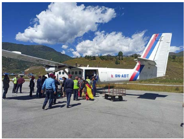
दिलमाया शाही/मध्यान्ह जुम्ला, १४ फागुन

एक दशकपछि नेपाल एयरलाइन्सको जुम्ला-सुर्खेत उडान शुरु भएको छ। नेपाल एयरलाइन्सको दिवसअट्टर जहाजले १० वर्षपछि जुम्ला-सुर्खेत उडान गरेको हो। सोमवार बिहान नेपालगञ्जबाट आएर जुम्ला विमानस्थलमा ७:५० मिनेटमा अवतरण गरेको जहाजले दुई जना यात्रु लिएर सुर्खेतको उडान गरेको छ।