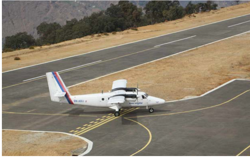
कमल कुमाल मध्यान्ह कालीकोट, १४ फागुन

कर्णाली प्रदेशको पहाडी जिल्ला कालीकोटको नरहरिनाथ गाउँपालिकाको कोटवाडामा निर्मित सुनथराली विमानस्थलको