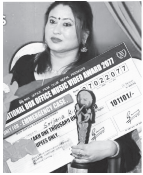
मध्यान्ह संवाददाता काठमाडौं, २९ जेठ

'राष्ट्रको सर्वश्रेष्ठ अवार्ड' नेसनल बक्स अफिस म्युजिक अवार्ड-२०७६' रिसया संस्करण अन्तर्गतको अवार्ड यसपटक काठमाडौंमा सामाजिक दूरी कायम गर्दै लकडाउनको बीच प्रदान गरिएको छ। कोभिड १९ कोरोना भाइरसको कारण विश्व नै लकडाउनमा रहेको अवस्थामा यो अवार्ड कार्यक्रम बक्स अफिस इन्टरनेसनल गुपले लकडाउनको कठिन समय पनी विश्व स्वास्थ्य संगठनको मापदण्डलाई पालन गर्दै सामाजिक दूरी कायम राखी सम्पन्न गरेको हो।