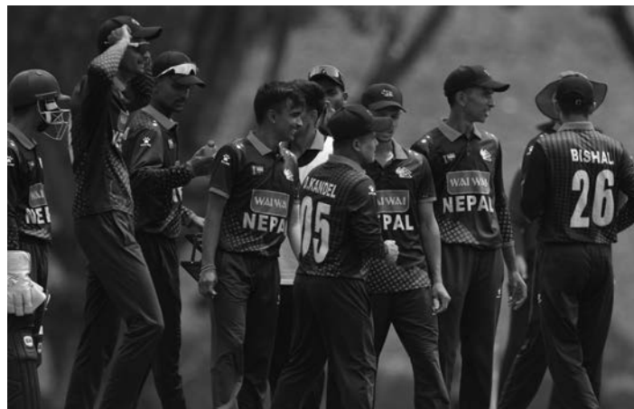
बाइएसडी युकेएम ओभलमा शनिवार जापानसँग खेलेछ। नेपाल र जापानबीचको खेल नेपाली समय अनुसार बिहान सवा ७ बजे शुरु हुनेछ।

काठमाडौं/सस- मलेसियामा जारी एसीसी यु-१९ प्रिमियर कप क्रिकेटको सेमिफाइनलमा नेपालले जापानसँग प्रतिस्पर्धा गर्ने भएको छ। नेपाल समूह 'ए' र जापान समूह 'डी' को विजेताको रूपमा सेमिफाइनल खेल लागेका हुन्। शुक्रवार हडकडलाई डकवर्थ लुइस (डीएलएस) पक्षको आधारमा ५७ रनले हराएर जापान समूह विजेता बनेको हो। नेपालले इरानलाई २ सय ७४ रन, बहराइनलाई ७ विकेट र साउदी अरेबियालाई ३ सय १ रनले हराएको थियो। दोस्रो सेमिफाइनल खेलमा समूह 'बी' को विजेता यूई र समूह 'सी' को विजेता सिंगापुरबीच प्रतिस्पर्धा हुनेछ। अब नेपालले मलेसियाको