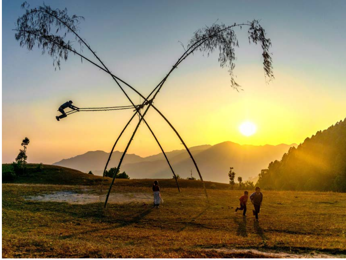
संस्कृतिको विन्ता: बदलिदो समयसँगै दशैं मनाउन तरिका पनि बदलिइएको छ । विशेषगरी सामाजिक सञ्जालको उपयोगमा आगसर्वसाधारणको पहुँच बढेसँगै दशैंको शुभकामना दिने शैली बदलिइएको छ भने परम्परागत पिछ खेल्ने र चंगा उडाएर मनोरञ्जन लिने संस्कृति बिस्तारै हराउँदै जाइएको छ । फाइल फोटो