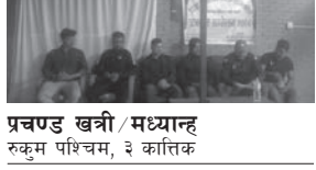
प्रचण्ड खत्री/मध्यान्ह रुकुम पश्चिम, ३ कात्तिक

रुकुम पश्चिमको चौरजहारीमा तेस्रो बृहत् चौरजहारी पर्यटन, व्यापार तथा सांस्कृतिक महोत्सव आयोजना गरिने भएको छ । शहीद स्मृति कला सांस्कृतिक केन्द्र चौरजहारीले शुक्रबार पत्रकार सम्मेलनमार्फत कात्तिक १३ देखि १५ गतेसम्म महोत्सव आयोजना गर्न लागिएको जानकारी दिएको हो । महोत्सव मूल आयोजक समितिका अनुसार चौरजहारीको कृषि, पर्यटन तथा कला-संस्कृतिको प्रचारप्रसार गर्ने उद्देश्यले महोत्सव आयोजना गर्न लागिएको हो । महोत्सवमा राष्ट्रिय स्तरका ह्यातिपिप्ला कलाकार, इन्ट्रिपी समूह र स्थानीय कलाकारको प्रस्तुति रहने बताइएको छ । त्यस्तै पालिकाका १४ वटै वडाका सांस्कृतिक फोकीसहितका प्रस्तुतिसमेत महोत्सव अवधिभर प्रस्तुत गरिने छ । महोत्सवमा भण्डे १ सय २० वटा स्टल रहने आयोजकले जनाएको छ । महोत्सव समापनपछि भने आयोजकले चौरजहारीमा खानेपानी र शौचालय निर्माण गर्ने बताएको छ ।