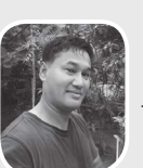
- यशु ब्रेष्ठ

ओलीले संविधान र संसदलाई अबमूल्यन गरे भनेर आलोचना गरियो। उनका ती कर्म गलत थिए, आलोचित थिए। संसद बचाएर देशलाई संविधान र विधिअनुसूच्य चलाउन जिम्मा लिएको गम्भन्न पनि त्यहि बाटोमा, भ्रष्टाभट अत्यादेश। गठबन्धनलाई पनि संसद घाँडो भएको हो ?