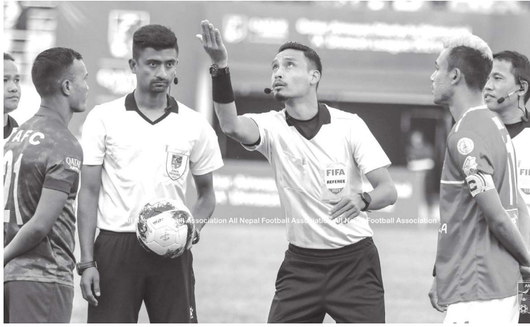
एन्फाले पनि सबै रेफ्रीलाई बाध्यकारी गरेको हो। रेफ्रीहरूले यसमा आपत्ती