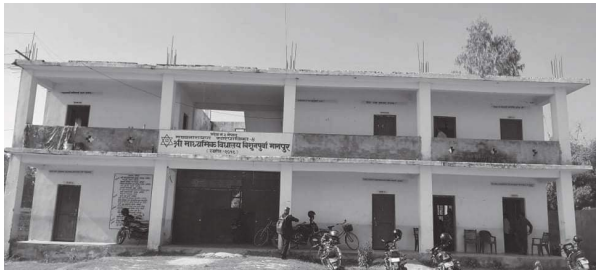
रौतहट, १६ मंसिर