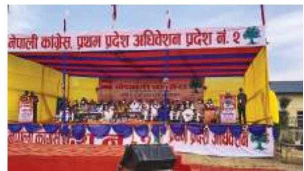
जनकपुरधाममा नेपाली कांग्रेसको प्रदेश-२ को अधिवेशन उदघाटन सत्रमा उपसभापति बिमलेन्द्र मिथि लगायत नेताहरू ।